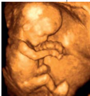
ÉCHOGRAPHIE 3D DU FŒTUS À 12 SEMAINES DE GROSSESSE

Servir : Tu précises que tu n'es pas en accord avec la pratique de l'IVG.