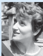
PROPOS RECUEILLIS PAR MARIE CHRISTINE FAVE

Il exerce à Marseille et y fréquente l'assemblée CAEF du CEP.