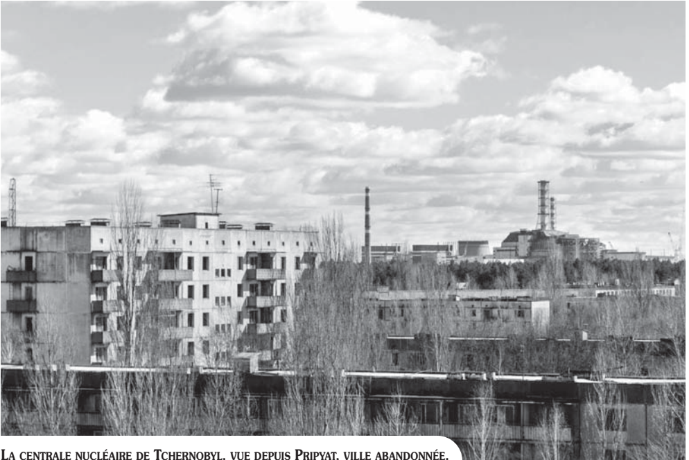
LA CENTRALE NUCLÉAIRE DE TCHERNOBYL, VUE DEPUIS PRIPYAT, VILLE ABANDONNÉE.

(Jr 14.14 ; Éz 13.19 ; Za 13.3). Tout homme est menteur (Ps 116.11).