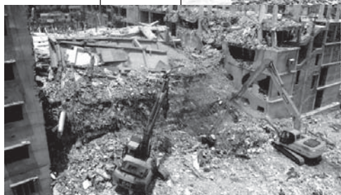
L'IMMEUBLE DU RANA PLAZA, À DACCÀ

Le commerce équitable nous permet de répondre aux problèmes d'éthique qui sont tant négligés dans nos sociétés, de montrer aussi à nos contemporains que nous sommes soucieux du sort de notre prochain sur tous les plans et pas uniquement spirituels.