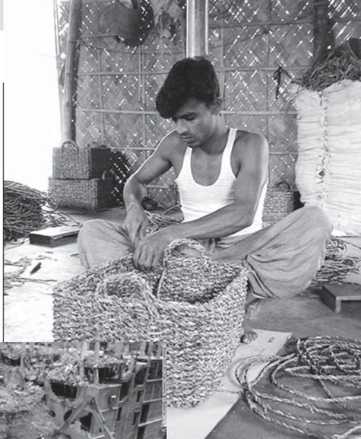
BANGLADESH, TRAVAIL DE LA FIBRE DE PALME

Je cite, en conclusion, cette prière de l'évêque de Meaux (lue dans une aumônerie) :